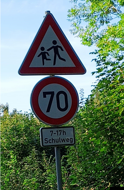
Auf dem Land sind sogar die Kinder robuster, die kann man auch mit 70 Sachen anfahren