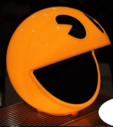
Was organisieren die denn?