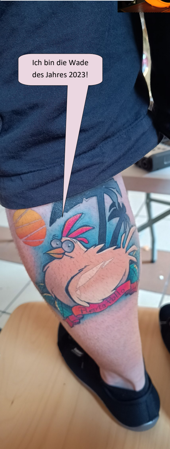
Ich bin die Wade des Jahres 2023!