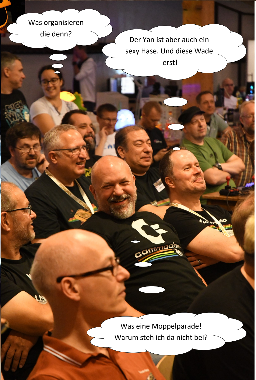
Was eine Moppelparade! Warum steh ich da nicht bei?