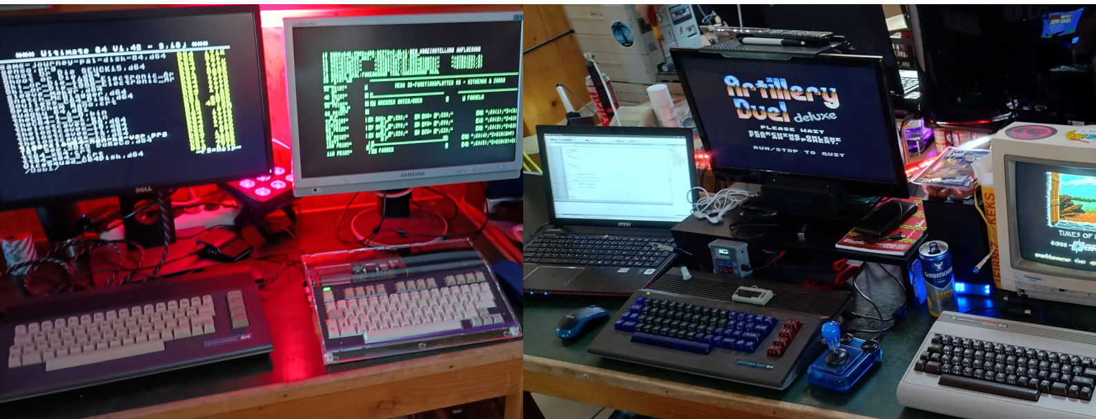
Mega65 und ein Commodore 64