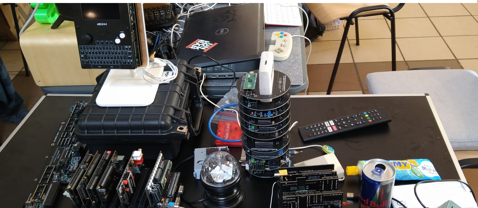
ühhhh, eine Fliege!