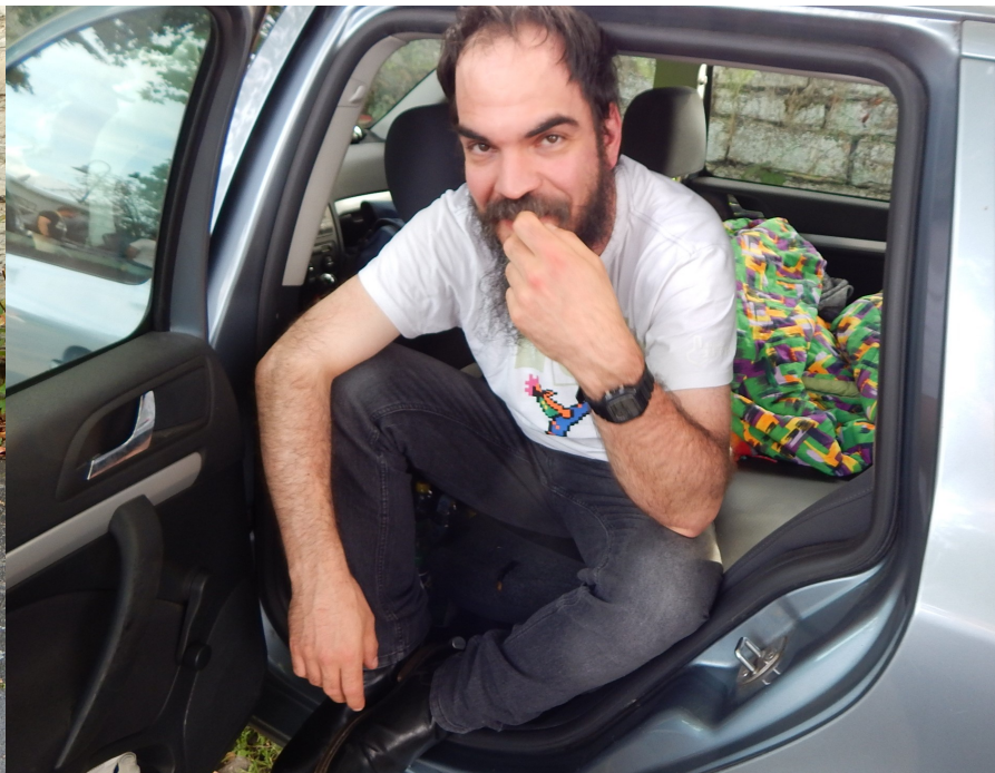
Strategien für die Zukunft