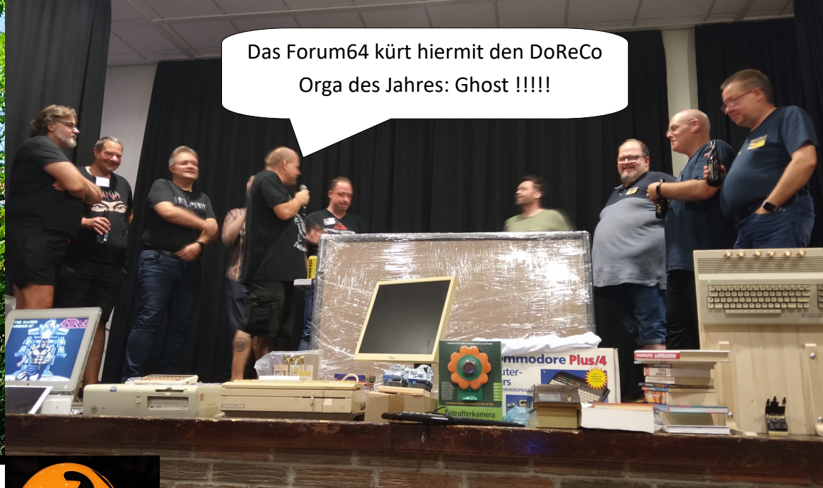
Das Forum64 kürt hiermit den DoReCo Orga des Jahres: Ghost !!!!!